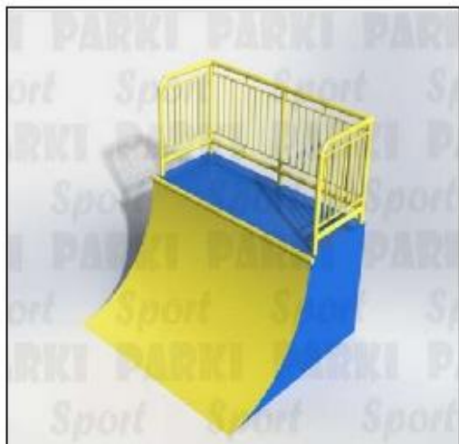
Хандр пайп ХП-001