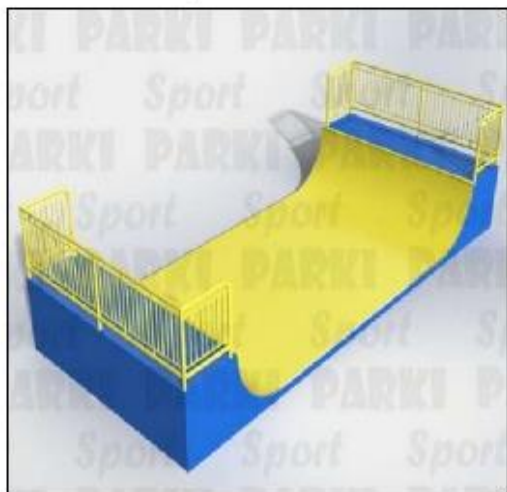
Хандр пайп ХП-001