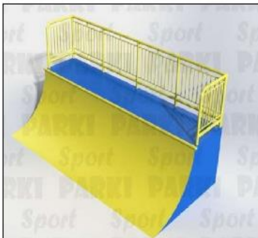
Риджвейв роупл РТ-001