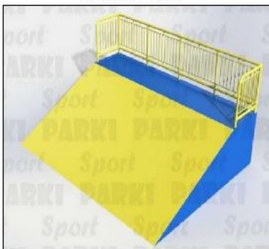
Риджвейв роупл РТ-001